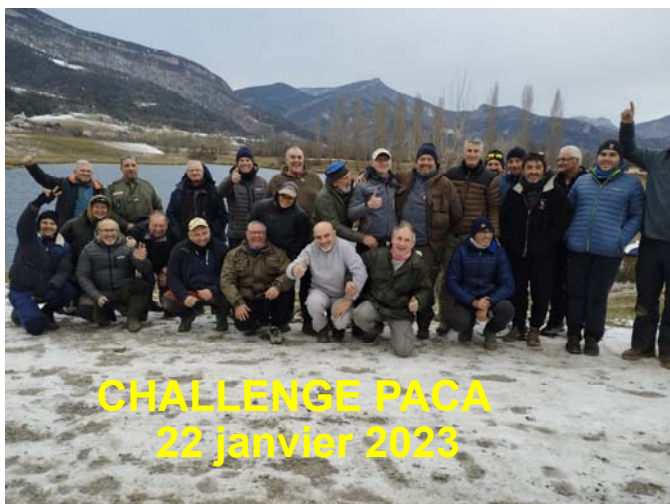
CHALLENGE PACA 22 janvier 2023