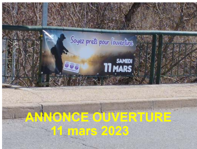
ANNONCE OUVERTURE 11 mars 2023