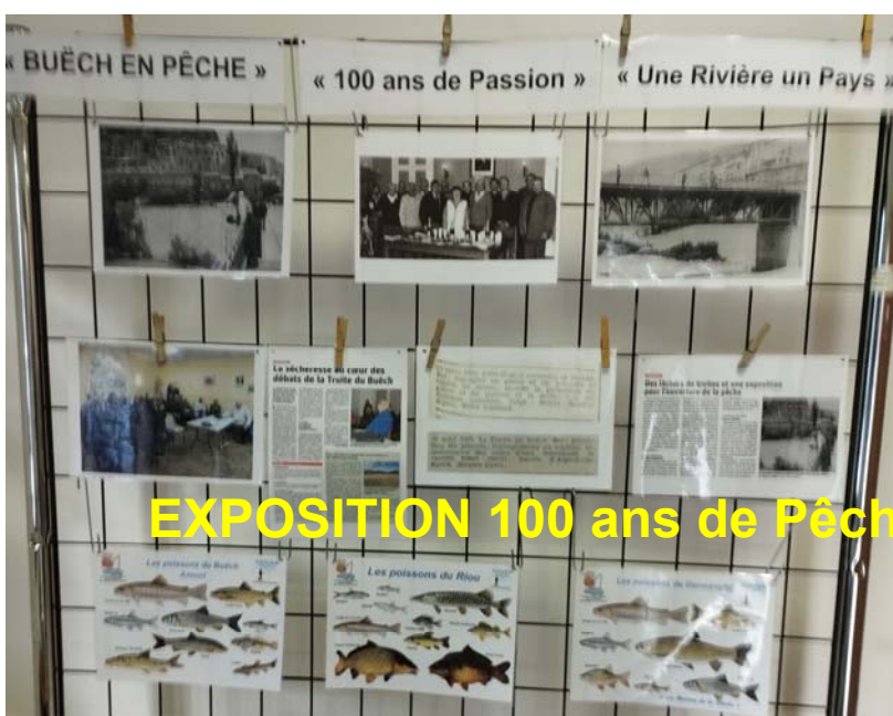
EXPOSITION 100 ans de Pêche sur le Buëch 2023